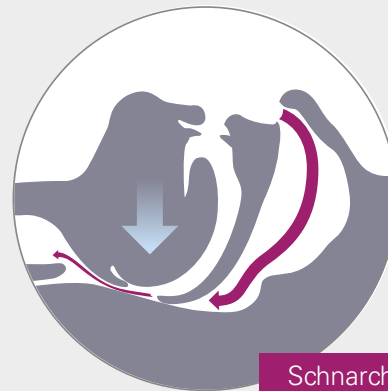
Schnarchen Gestörter Luftstrom